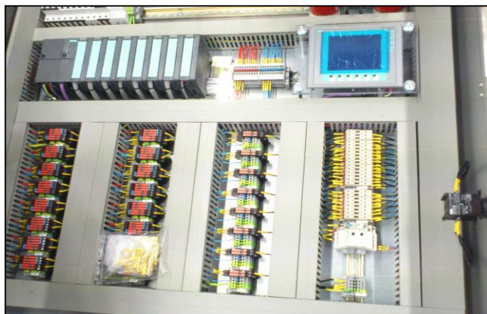
Vista del cuadro eléctrico